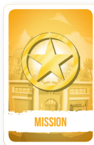
Carte « Mission »