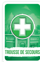
Carte « Trousse de secours »